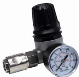
Régulateur d'air : Réf. 7728