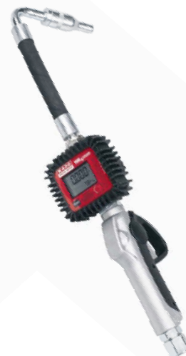
Pistolet compteur : Réf. KPR