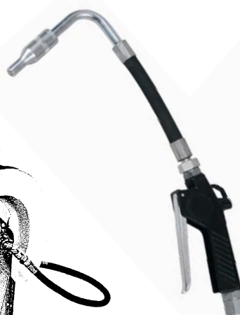
Pistolet : Réf. GRH3179